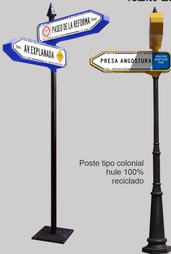
Poste tipo colonial hule 100% reciclado